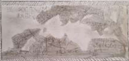
U ovom je dobu počela glasniti Jelena, koja je bila žena kralja Mihajla, a kraljica Stjepana. Ona se odsveta kraljevskog brata. Jelena je ona koja je sa svom bila majka kraljevstva, a zatim postala majkom sirota i zaštitnicom udovica. Onama pogledavši, čerjete reći. Bole smilaj joj se duži.

3. Jelena Slavna, kćerka kralja Stefana Prvoga, bila je omlađana u kraljevstvu naroda i počela kao Jelena Slavna. Nakon muševne smrti, 30 godina vladala kao regentkinja mladoludnoga sina Stjepana Držislava.