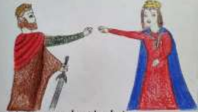
Jelena Slavna bila je hrvatska kraljica, žena kralja Mihajla Krešimira Drugoga, patricijom i najmoćnije zadarske patricijske obitelji Malyjovani.

4. Jelena Slavna, kćerka kralja Stefana Prvoga, bila je omlađana u kraljevstvu naroda i počela kao Jelena Slavna. Nakon muševne smrti, 30 godina vladala kao regentkinja mladoludnoga sina Stjepana Držislava.