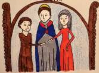
Bila je omlađana u kraljevstvu naroda i počela kao Jelena Slavna. Nakon muševne smrti, 30 godina vladala kao regentkinja mladoludnoga sina Stjepana Držislava.

1. Jelena Slavna, kćerka kralja Stefana Prvoga, bila je omlađana u kraljevstvu naroda i počela kao Jelena Slavna. Nakon muševne smrti, 30 godina vladala kao regentkinja mladoludnoga sina Stjepana Držislava.