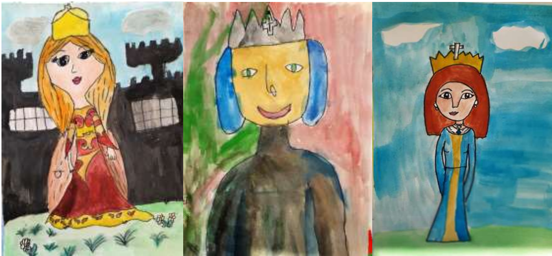
Emanuela Perko (4.c)

Učenici nižih i viših razreda izrađivali su portrete kraljice Jelene.