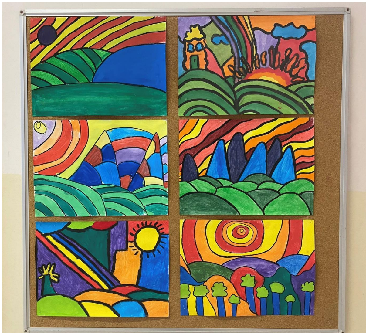
Na fotografiji su učenički radovi.