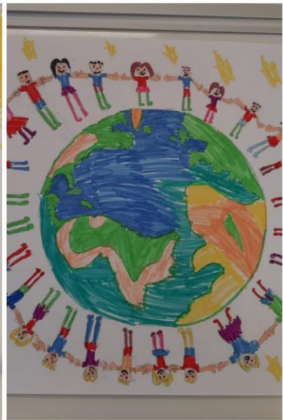
Na fotografiji su učenički radovi.