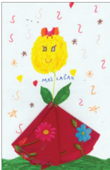
Lara Vuco 2. d