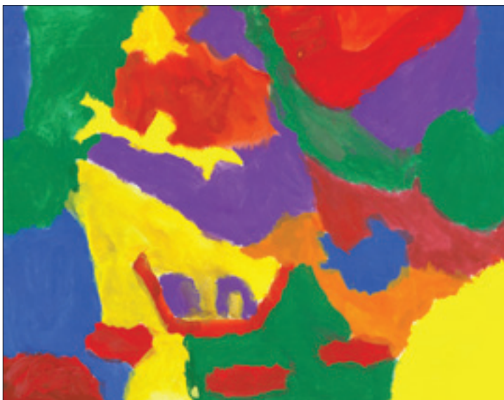
Danica Baković 4. b