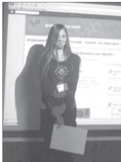
Stella u Gračacu na Međužupanijskoj smotri.

U program je danas uključeno preko 100 zemalja, s ukupno preko 13.000 škola, a na svakom od kontinenata (pa čak i na Antarktiku) postoji bar jedna GLOBE škola.