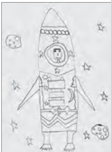
Jakov Malenica 4. b