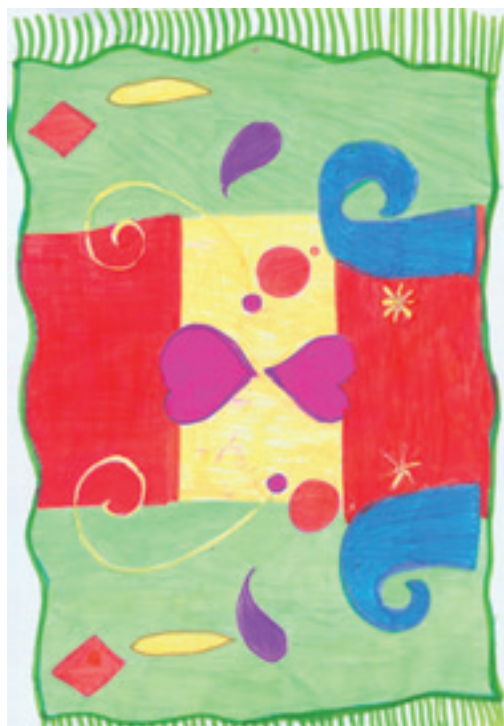
Sara Burazer-Turko 4. b