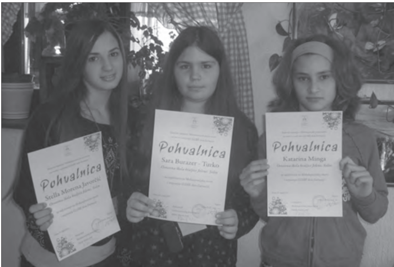
Ekipa naše škole s pohvalama za sudjelovanje na Međužupanijskoj smotri Gračacu (ožujak 2010.)