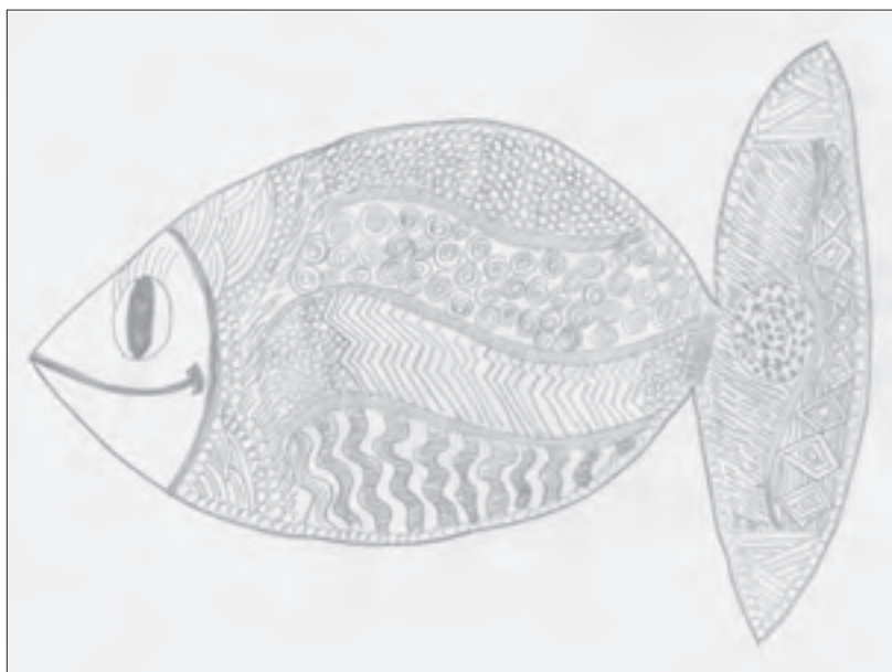
Antonija Čondić - Bijader 7. b