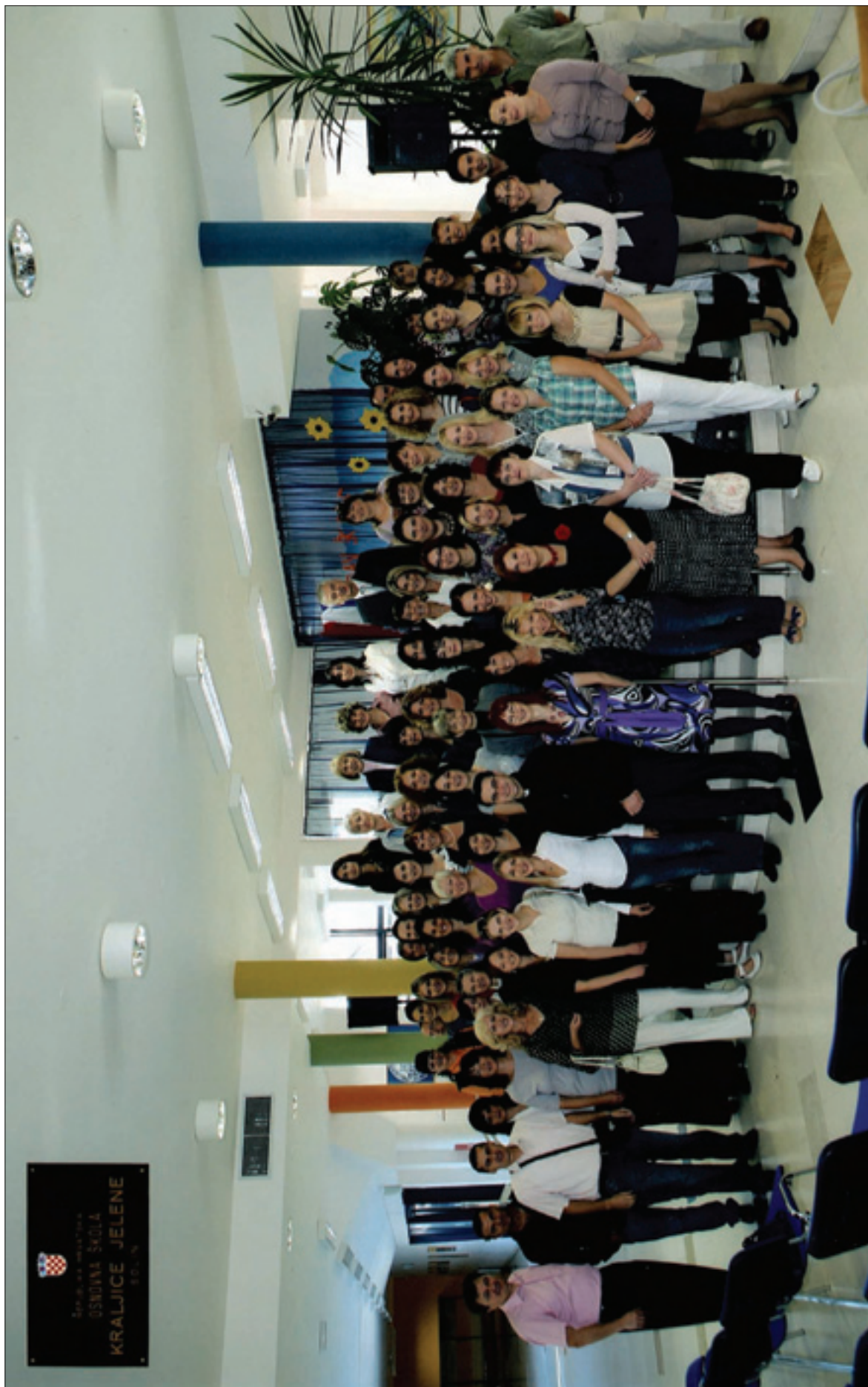
Djelatnici Osnovne škole kraljice Jelene, šk. god. 2010./2011.