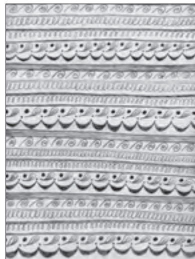
Emanuela Plosnić 8. c