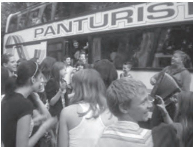
Uz harmoniku, veselje

Svi smo se okupili u dogovoreno vrijeme na velikom parkingu pokraj Gospina otoka i pozdravili se s roditeljima koji uvijek imaju neki savjet za nas. Ukrkali smo se u veliki lijepi autobus na kat i avantura je mogla početi. Jedan od najboljih djelova ekskurzije bio je boravak u autobusu. Svi smo se zabavljali igrajući karte, fotografirajući se, slušajući glazbu, pričajući viceve i radeći još mnogo toga zanimljivoga. Krajolik nas baš i nije zanimao sve dok nismo došli do Slavonije. Svi su bili oduševljeni slavonskim nepreglednim poljima. Ravnica nas je očarala. To