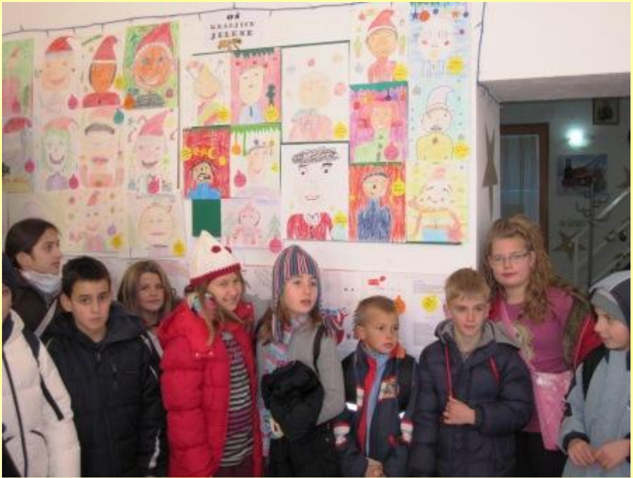
Ponosno smo se fotografirali ispred panoa s našim radovima.