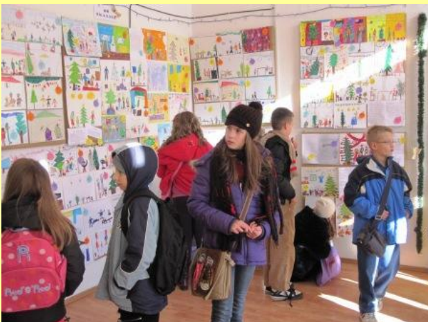
Svi učenici škole došli su pogledati izložbu.