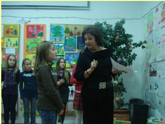
Gospođa Krželj pokazuje Evin rad