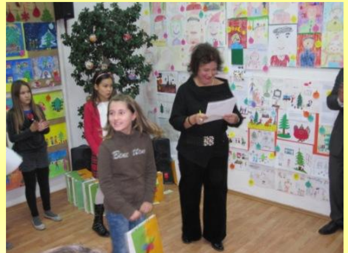
Osmijeh na licu sve govori.