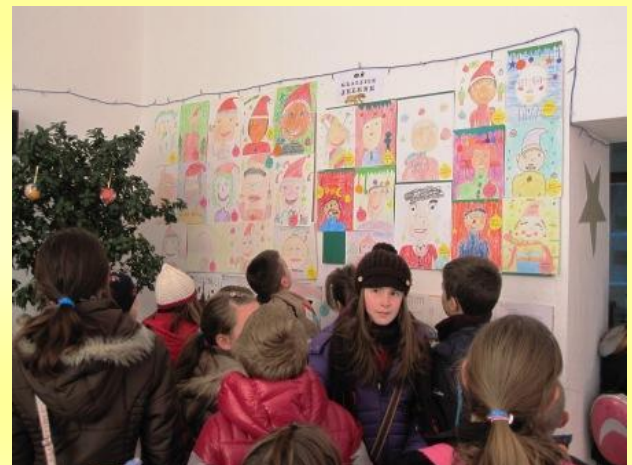
Najveća gužva nastala je ispred panoa s našim radovima.