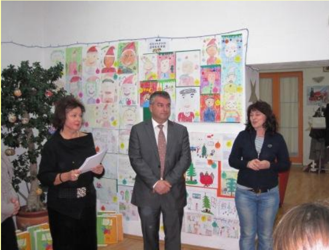
Gospođa Krželj s uzvanicima na otvaranju izložbe.