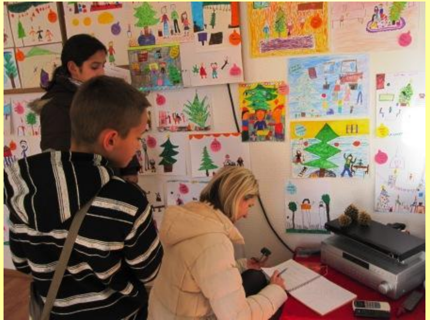
Na kraju smo se upisali u knjigu dojmova.