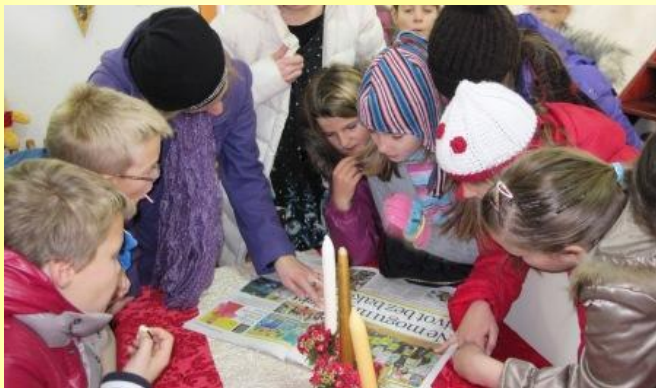
Sa zanimanjem čitamo članak u Slobodnoj Dalmaciji.